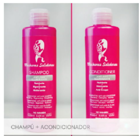
CHAMPÚ + ACONDICIONADOR

reestructurante y fortalecedor. Para mejorar aún más la acción del champú, tenemos el acondicionador, también iluminante, desenredante y con efecto antiencrepamiento. Los dos productos han tenido mucho éxito y han cumplido con la expectativa de nuestros clientes.